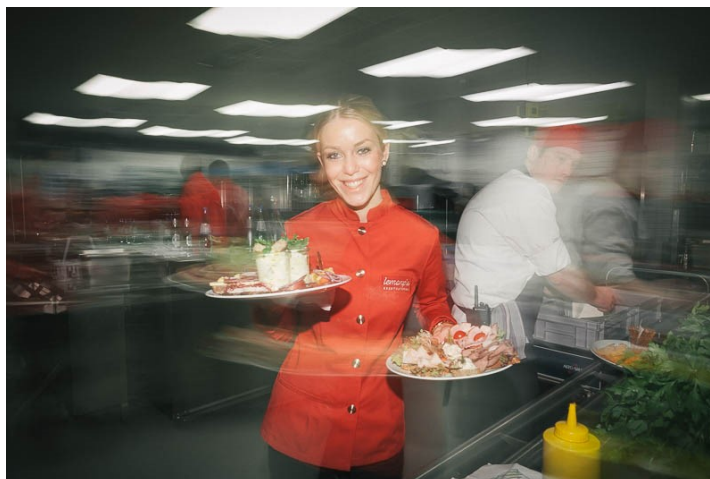
Servicejacken Grand Café Rau und Lemonpie Evencatering