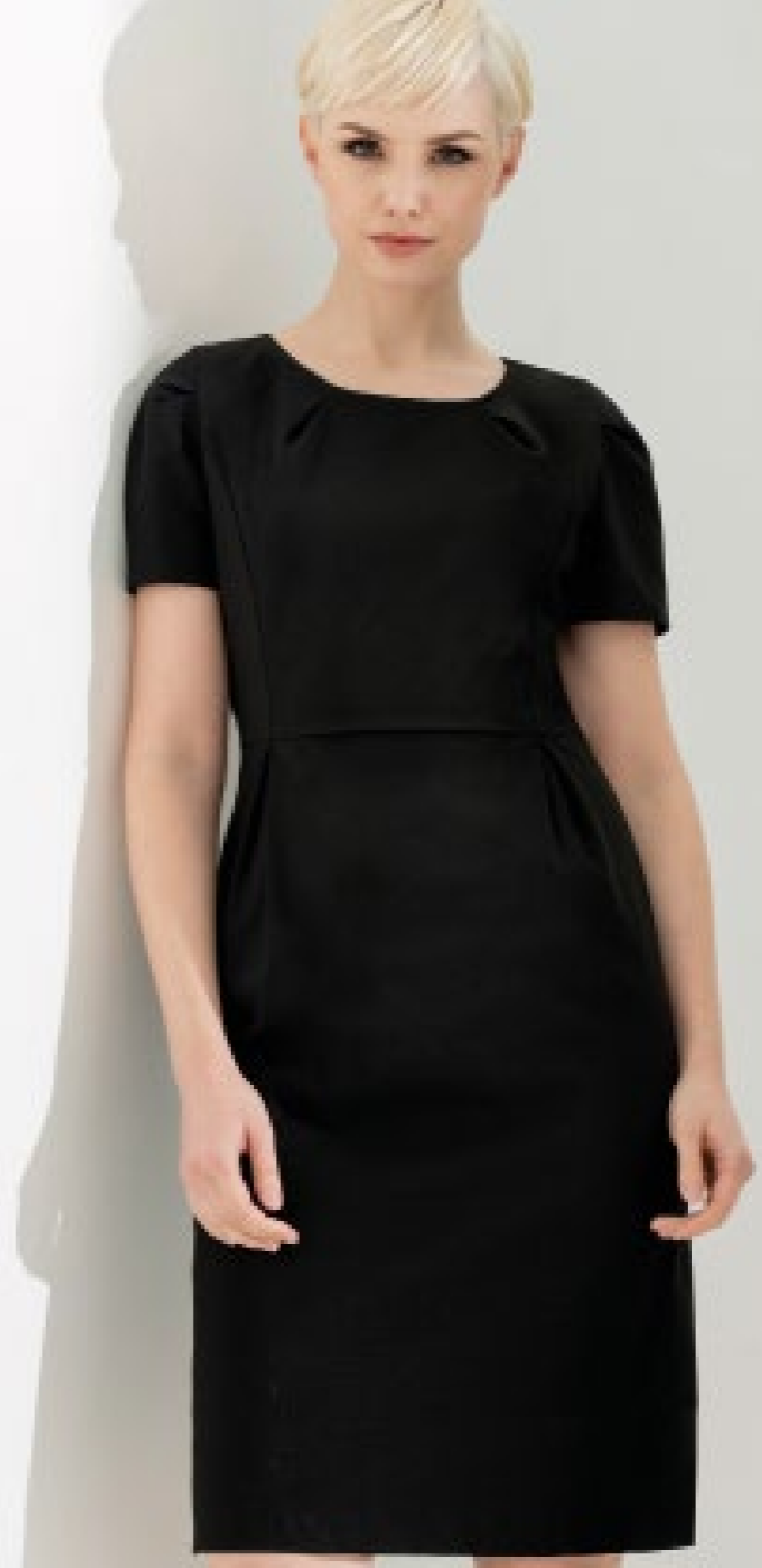
Bild - Primrose Kleid Schwarz