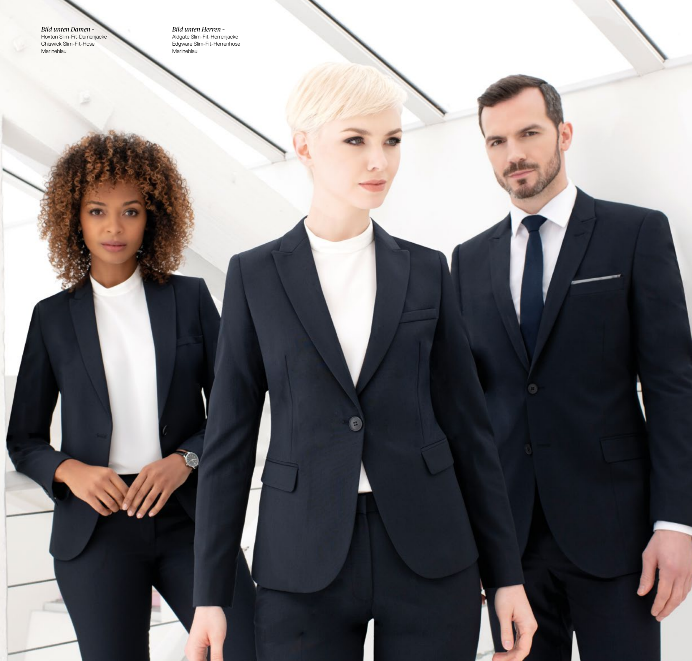
Bild unten Herren - Aldgate Slim-Fit-Herrenjacke Edgware Slim-Fit-Herrenhose Marineblau

Bild unten Damen - Hoxton Slim-Fit-Damenjacke Chiswick Slim-Fit-Hose Marineblau