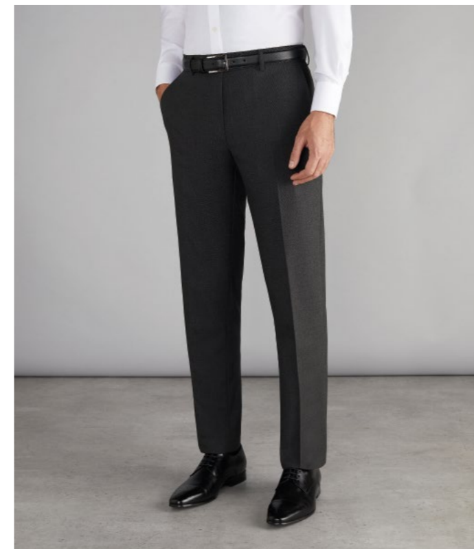
Bild unten - Putney Tailored-Fit-Komfortbundhose Anthrazit

Bild links - Farringdon Tailored-Fit-Jacke Harrow Tailored-Fit-Hose Anthrazit