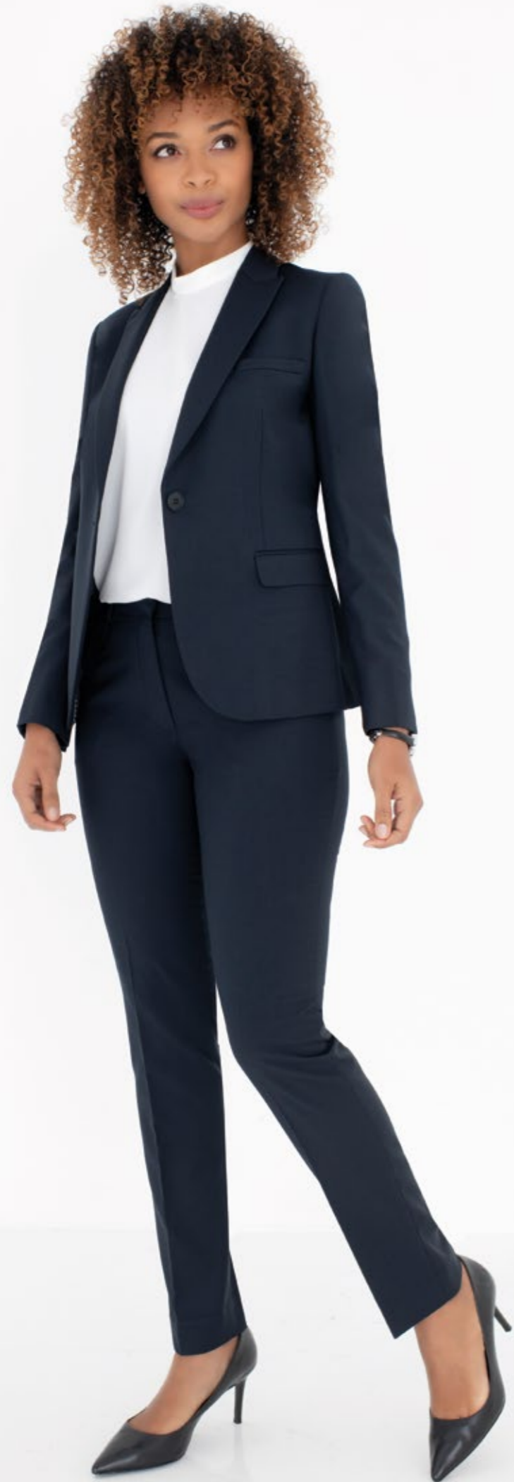
Bild unten - Hoxton Slim-Fit-Jacke Chiswick Hose Marineblau