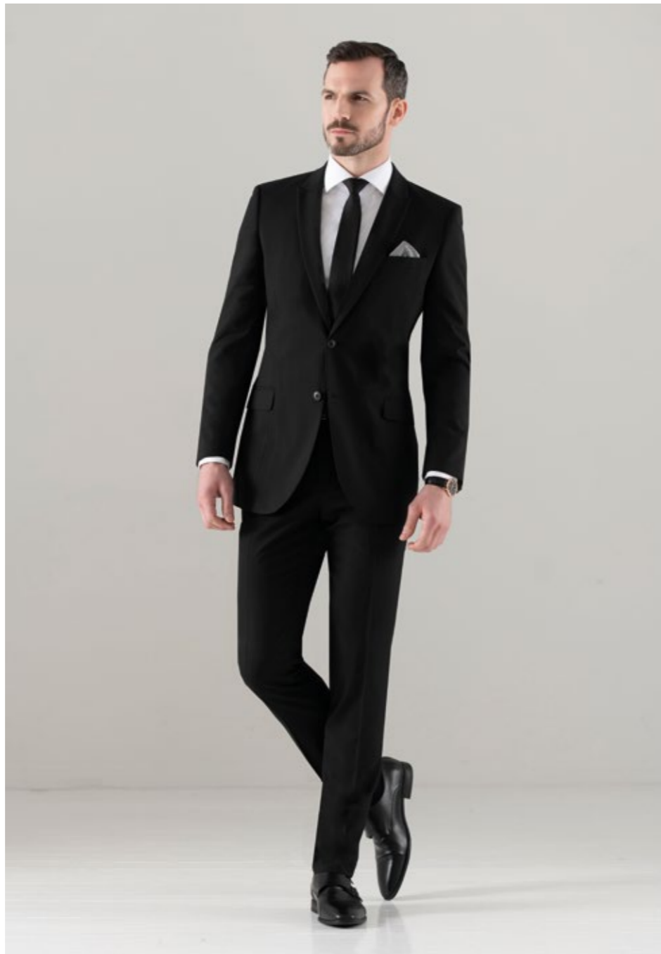
Bild unten - Aldgate Slim-Fit-Herrenjacke Edgware Slim-Fit-Herrenhose Hellgrau