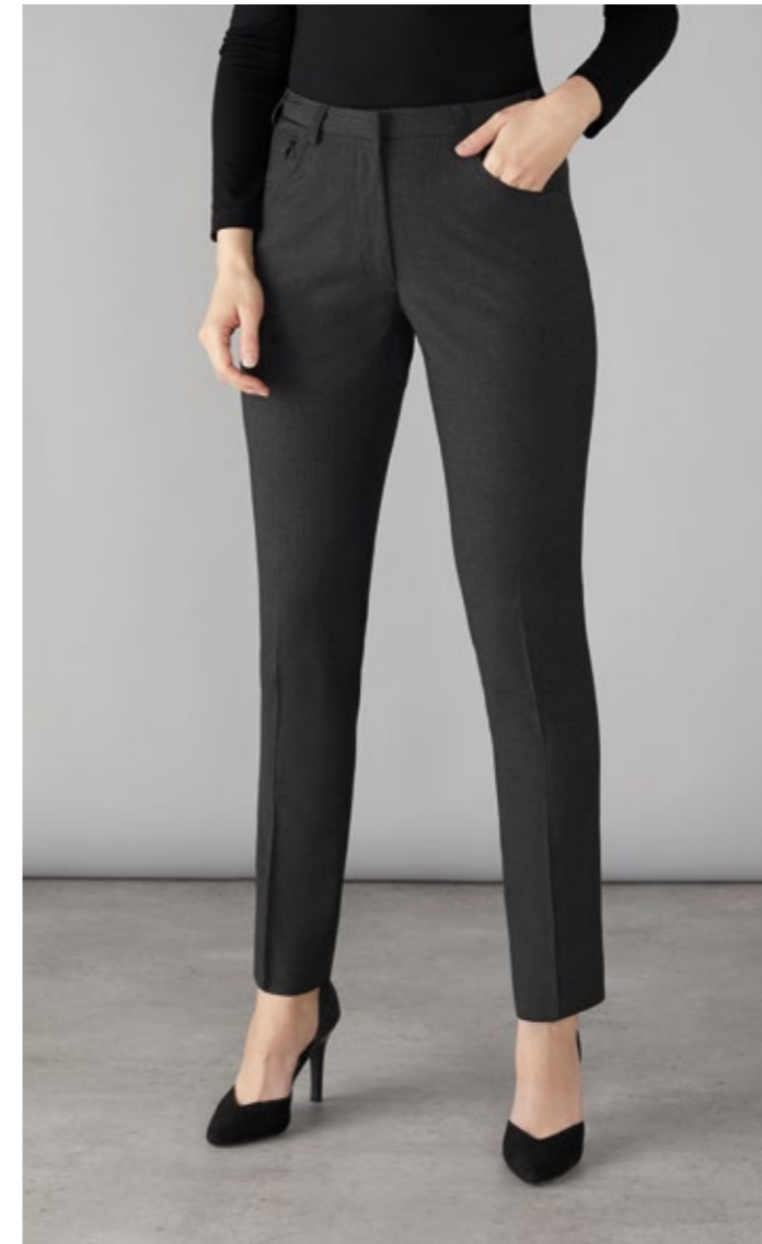
Bild unten - Chiswick Hose Anthrazit