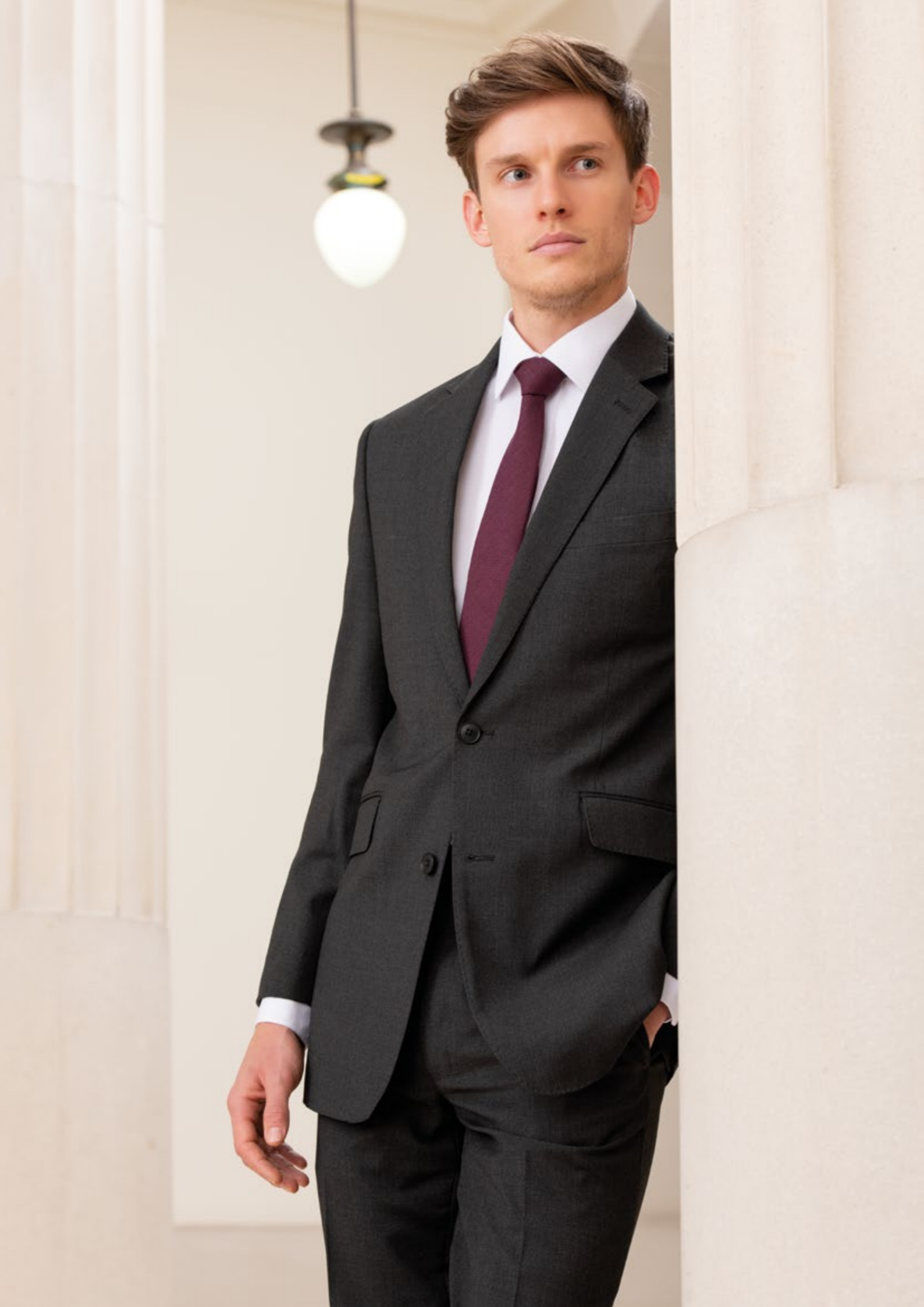
Bild links - Farringdon Tailored-Fit-Jacke Harrow Tailored-Fit-Hose Anthrazit

Bild unten - Putney Tailored-Fit-Komfortbundhose Anthrazit